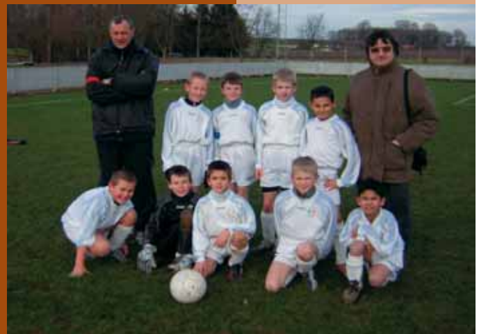
De premieren B van het SWV-Gingelom speelden de heenronde zonder verlies.